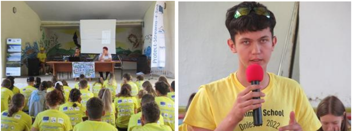
Пресс-конференция, организованная самими участниками

К пресс-конференции местные СМИ из числа созданных участниками готовились очень серьезно, поэтому вопросы задавали сложные, взрослые. И отвечать выступающим приходилось подробно и обстоятельно. Иначе и быть не могло.