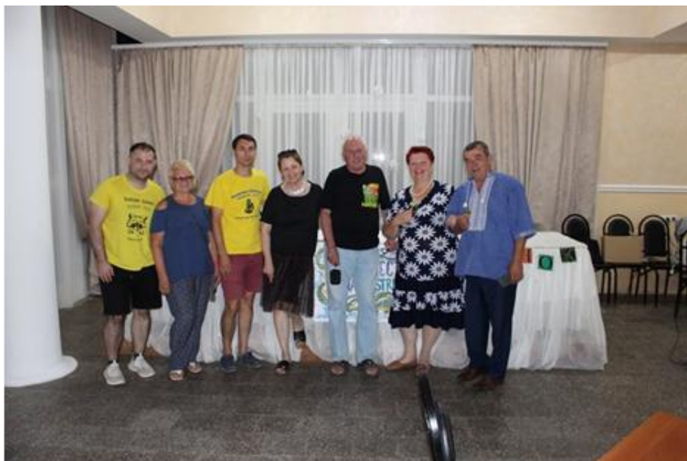
Организаторы и мы, доброжелательные судьи.