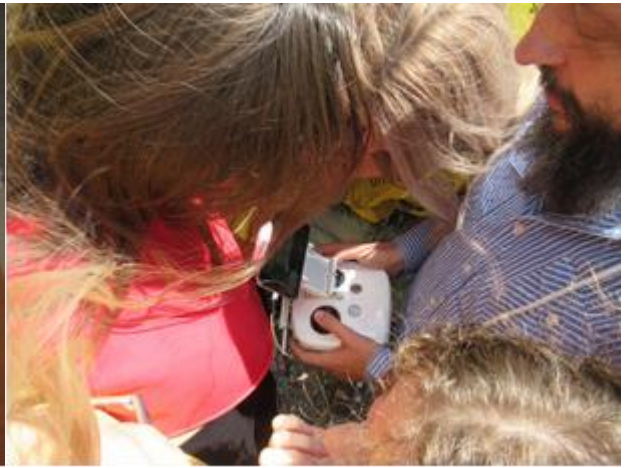
Демонстрируем возможности дрона и его использование для оценки эрозии

Эрозия берегов играет важную роль в органическом загрязнении Днестра и Черного моря. А водная эрозия несет смытый гумус в Черное море, уменьшая плодородие и вызывая цветение северо-западной, наиболее мелкой и продуктивной части моря, куда впадают основные реки - Дунай, Днестр, Южный Буг и Днепр.