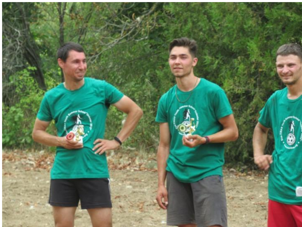
Участники антирасистского футбольного матча