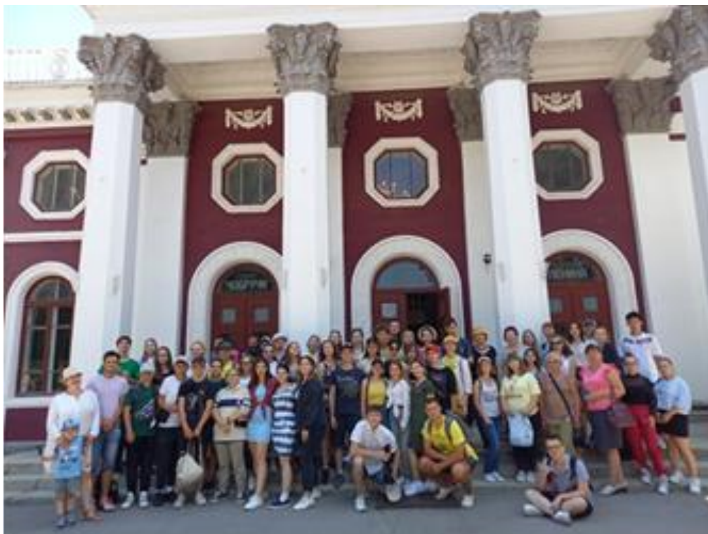
Мы в Чобручах!

Побывать в Чобручах и не посмотреть на пороги Турнучука никуда не годится! Конечно же, мы побывали на Турнучуке, полюбовались. Хоть и искусственные пороги, но красиво же!