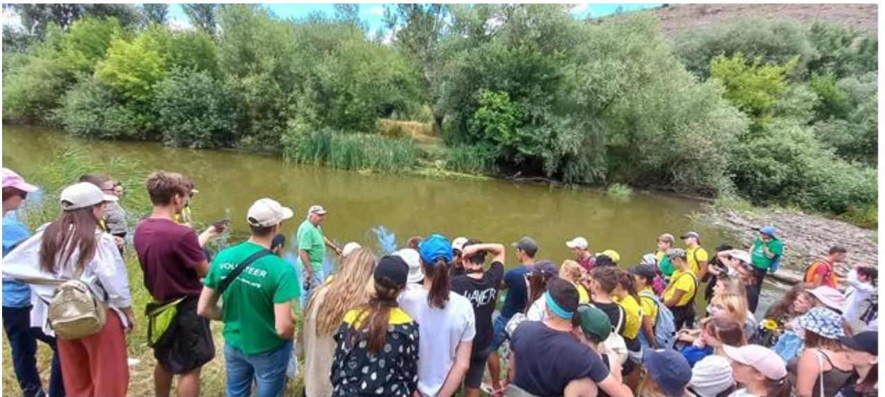
Оценка береговой эрозии Днестра в с. Чобручи и Реута у с. Требужень