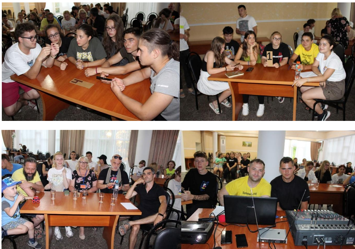
Участники команд «Что? Где? Когда?»

Интеллектуальные игры у нас в чести. Например, «Что? Где? Когда?» Наши тренеры тоже бросаются в бой. И даже не боятся играть с участниками!